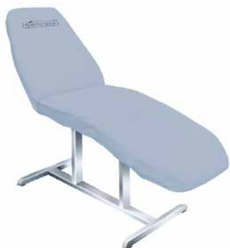
Pokrowiec na fotel